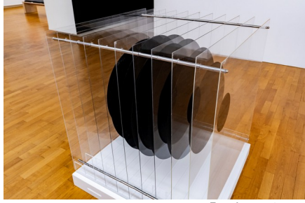
Boule en tranches Michel Jouët, 1967