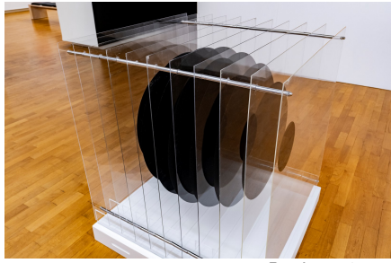
Boule en tranches Michel Jouët, 1967